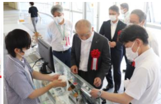
学生によるAGDの歴史と作品の説明