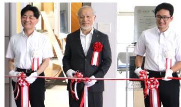
開所式でのテープカット

紹介を行いました。AGDはインターンシップの事前研修や創業イベントのリハーサル等で既に利用され、学生が技術力を磨いたり、創業を志して活動したりするための場となっています。本学のIDカードを保有する人ならどなたでも利用可能です。ぜひご活用ください。