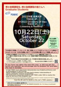
Poster encouraging graduate students to take the next TOEIC exam