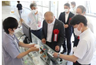
Students explaining the history of AGD and their works