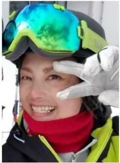
New! 沖 和砂 スポーツ 健康科学