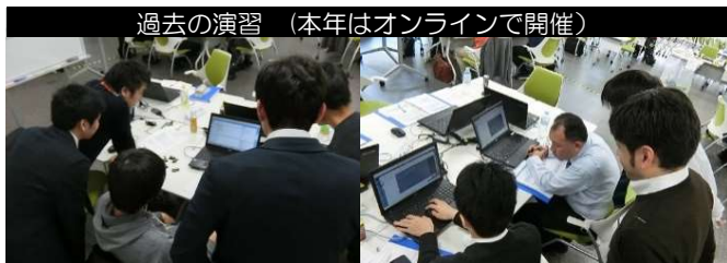
過去の演習（今年はオンラインで開催）

本講座ではサイバーレンジと呼ばれるサイバー攻撃防御演習システムを用いた演習を行います。このサイバー演習に理想的な環境をベースとして本講座向けに作成したシナリオを用いた実践的な演習を中心に実施します。本学の講座の特色として、「攻撃手法」から防御技術を学ぶことに重点をおいた演習です。