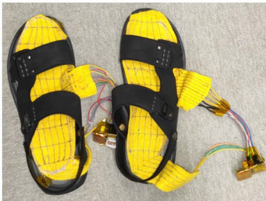
中敷センサを靴に入れて