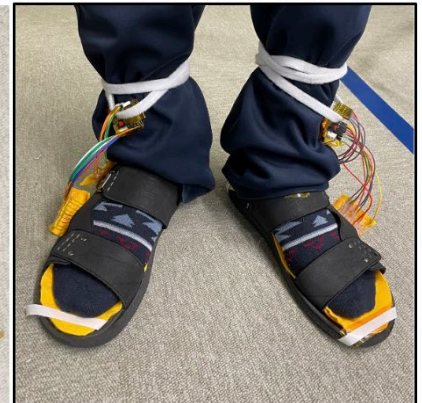
何かに活用できるか？