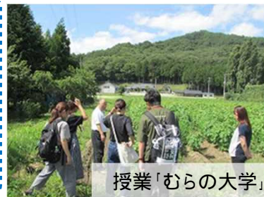
授業「むらの大学」（川内村・南相馬市）