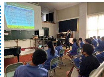
「復興知」エクステンション」展開（写真は中学校での「復興知」授業）