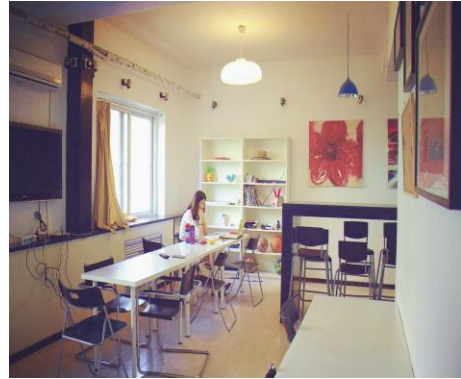
留学生宿舍交流室